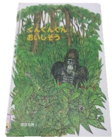
ぐんぐんぐんおいしそう