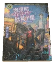
幽落町おぼけ駄菓子屋